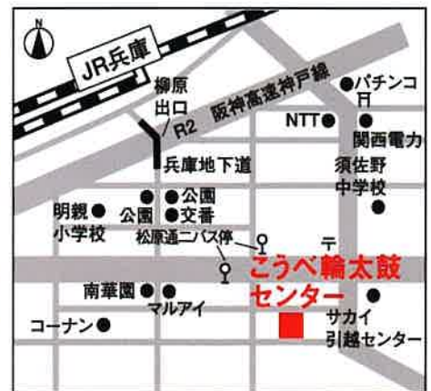
▲JR兵庫駅より南に徒歩8分

■申し込み先/こうべ輪太鼓センター 〒652-0882 神戸市兵庫区芦原通 2-1-23 TEL 078-685-3535 FAX 078-685-3536 e-mail:kobe@wadaiko-center.com http://www.wadaiko-center.com/