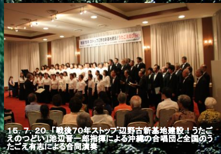
15.7.20「戦後70年ストップ!辺野古新基地建設!うたごえのつどい」池辺晋一郎指揮による沖縄の合唱団と全国のうたごえ有志による合同演奏