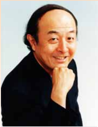
SHIN-ICHIRO IKEBE 池辺 晋一郎