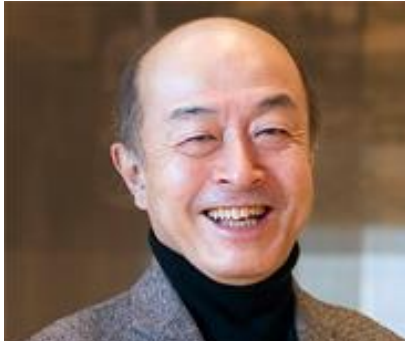
池辺晋一郎 (作曲家)