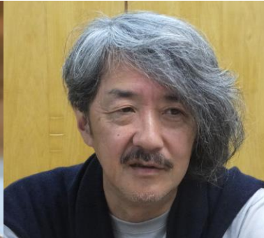
井上鑑 (キーボード奏者・アレンジャー・プロデューサー)