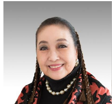
湯川れい子 (音楽評論家 作詞家)