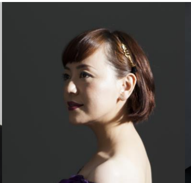
普天間かおり (歌手)