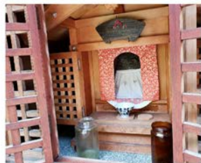
▲祠の中のお地藏さん

京都市内にはたくさんのお地藏さんが祭られています。その数50000体余りと言われています。白く「お化粧」されていたり前垂れを着けてもらっていて大切にされていることがうかがえます。小さな祠に収められて