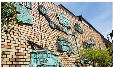
▲エンゼルハウス外壁レリーフ