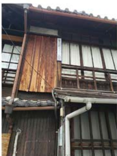
田区京上 田名京上 ▲昔の名町 中関田 (ろーじ) など

京都の市街地だからその 言い回し。北へは上ル、南 へは下ル。東西は、東入ル ・西入ルです。（寺町・御