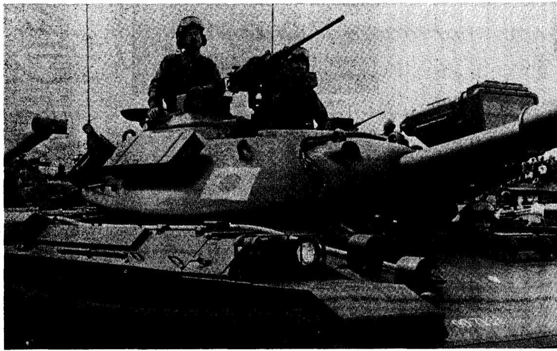
不気味な軍隊(自衛隊)の戦車に「日の丸」

「春 三月」 僕たちは今日、卒業してきます」 卒業生の思ひはますこの歌にこめられたわかれの。 「僕らはやむじつの仕事があるだけ自由の国境へ仕事が出し……」