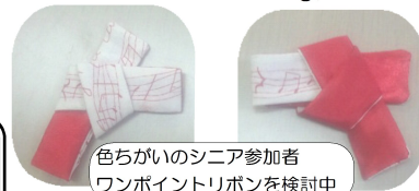
色ちがいのシニア参加者 ワンポイントリボンを検討中