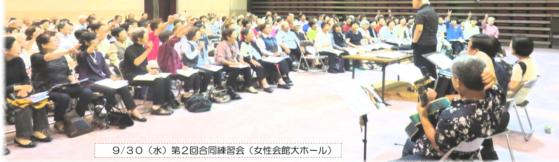
9/30(水) 第2回合同練習会(女性会館大ホール)