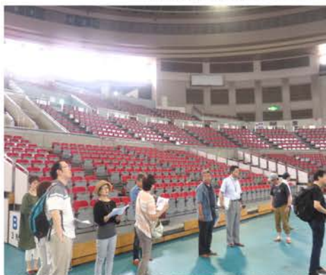
館職員の説明を聞き入るメンバー

した。まだ課題は多くありますが更なるみなが集える会場・運営にしたいと気込みが上がりました。全国から多くの参加者で、この会場を満席にしてうたごえを響かせましょう。