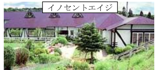
イノセントエイジ

終了後、JRで帰られる方は二本松駅まで車で送ります。 オプションの「蓮笑庵」に行く方は、車で分乗して行きます。